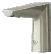
Níquel cepillado (-BN)