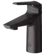
Negro mate (-MB)

La mayoría de los modelos tienen la característica estándar de dispositivo aspersor oculto sin aireador (V05), de 1.89 l/min (0.5 GPM). Los dispositivos de salida opcional están disponibles bajo pedido: