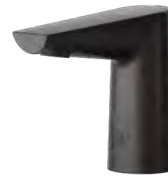
Negro mate (-MB)

La mayoría de los modelos tienen la característica estándar de dispositivo aspersor oculto sin aireador (V05), de 1.89 l/min (0.5 GPM). Los dispositivos de salida opcional están disponibles bajo pedido: