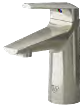
Níquel cepillado (-BN)